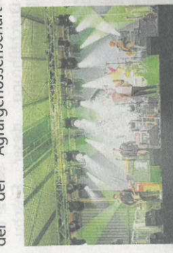
1.500 Gäste erlebten einen ereignisreichen Tag bei den Feierlichkeiten aus Anlass des 25-jährigen Jubiläums des Unternehmens in Altenweddingen.